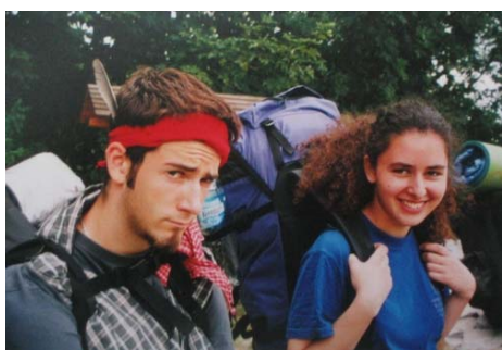
De nehéz a ... hátizsák!