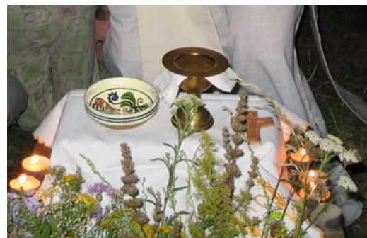
Szabadtéri oltár a táborozáskor

Az alábbiakban ismertetett szent bemutatásának módja eltér a korábban megszokottaktól: nem életrajzi adatok és ismeretek sorakoznak egymás után, hanem életszerűvé varázsolt módon, megidézett párbeszédnek segítségével mutatjuk be Szent Tarziciusz életét. Ministránsaink számára különösen érdekes lehet, hogy a gyermek szent a ministránsok védőszentje is. Legyetek rá büszkék, és próbáljátok meg követni a lelkületét!