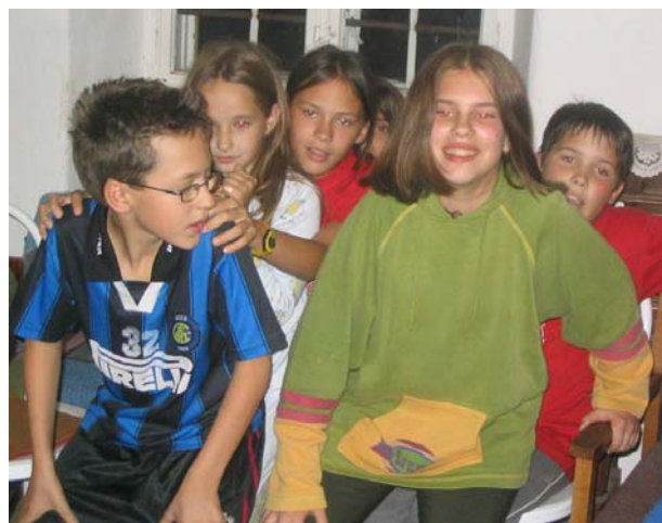
Így készült a „nyomasztó gyümölcssaláta”

Az odaúton a várakozástól csintalan gyermekeink dorgálásban részesültek, de vasárnap a krisztusi közösség csodáját megtapasztalva érkeztünk haza. (Gy, N)