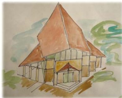
Közösségi Ház fantáziaterve (I. változat)

A közösségi ház terve: Az új közösségi házat a régi, lebontásra ítélt épület helyén tervezzük. Plébániánk közösségi igényei és anyagi erőforrásai alapján a következő nagyságrendű ház tervezése körvonalazódik: Egy közel 150 m 2 -es nagyterem előtérrel és a szükséges vizesblokkokkal, konyha, raktárhelység, plébániai iroda, garázs, és két hittanterem az emeleten, összesen kb. 250m 2 beépített alapterületen.