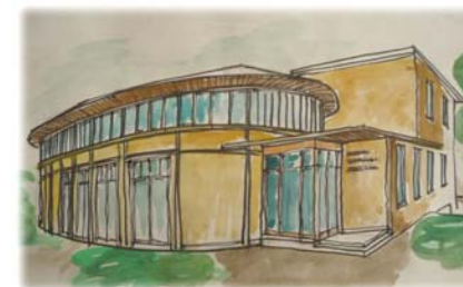
Közösségi Ház fantáziaterve (2. változat)

1000, 2000 és 5000 Ft-os címletekben, amelyek megvételével a házat támogatni lehet. Ezeket az irodában, és misék után a templomi kijáratnál lehet megvenni. Természetesen jóval nagyobb összegű adományokra is szükségünk van, amihez várjuk jómódú híveink felajánlásait. Aki átutalással bankszámlára vagy sárga csekk befizetéssel szeretné támogatni az építkezést, a közlemény rovatba írja be, hogy „Közösségi Háza”. Természetesen a Főegyházmegyétől is várunk anyagi segítséget, amivel folytatni tudnánk az építkezést. Adja Isten, hogy Házunk megépüljön, és közösségünk tovább gyarapodjon! plébános